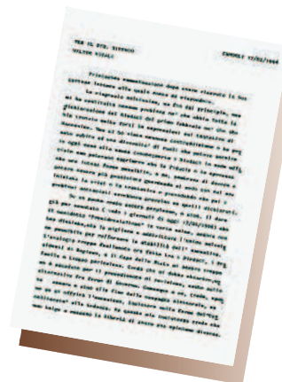
IL CARTEGGIO/2 La seconda lettera di Dossetti a Vitali è del 17 febbraio 1996

Oltre a Berlusconi, spuntano i nomi dell'ex ministro leghista Speroni e di Bassolino e Maccanico